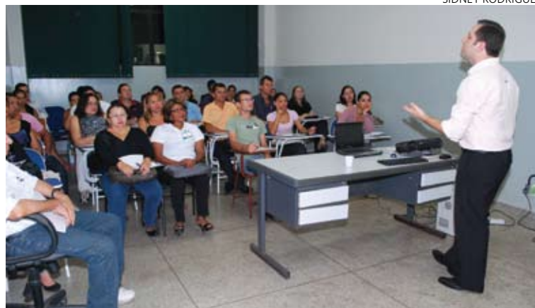
Palestras e minicursos tem atraído diversos participantes na feira

veram início os mini-cursos, com três oficinas coordenadas pelo Sebrae: "Atendimento ao Cliente", "Técnicas de Venda" e "Controle Financeiro". Ontem, aconteceu durante a manhã e à tarde, um quarto treinamento, o de "Educação Alimentar – Cozinha Brasil", oferecido pelo sistema Fiema. A atividade aconteceu no Sesi de Imperatriz. Hoje e amanhã, estão previstas novas palestras. Confira a programação: