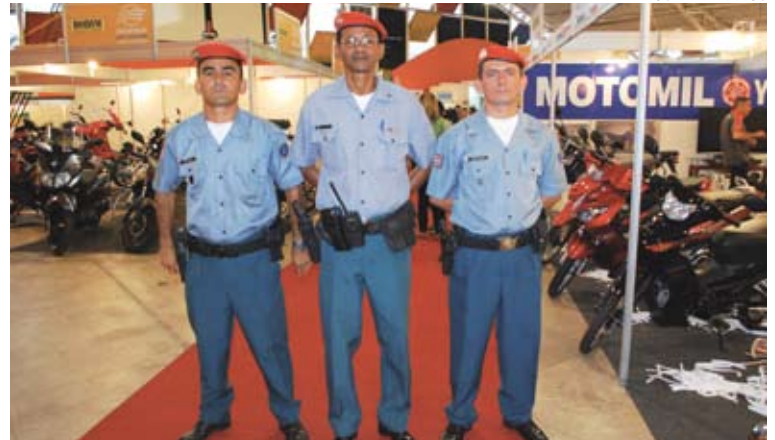
Polícia Militar e mais 15 homens treinados fazem segurança da feira

Segundo ele, os seguranças foram organizados em três turnos e vão atuar desarmados. “Temos consciência de que nos eventos o foco inclui muito mais orientação que repressão”, comenta. Polícia Militar também vai atuar na Fecoimp. O sargento Trindade, que organiza o